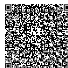
EU-Petition des BDPK

Ja, wir haben eine Menge auf den Weg gebracht und hoffen, in der laufenden Legislaturperiode beim Bundesfinanzminister mit unseren Punkten durchzudringen. Hilfreich ist dabei sicherlich, wenn wir bundesweit noch mehr Unterstützer aus dem Kreis der Privatkliniken ohne Versorgungsvertrag hinter uns vereinen können. Denn auch hier gilt: Zusammen sind wir stärker. ←