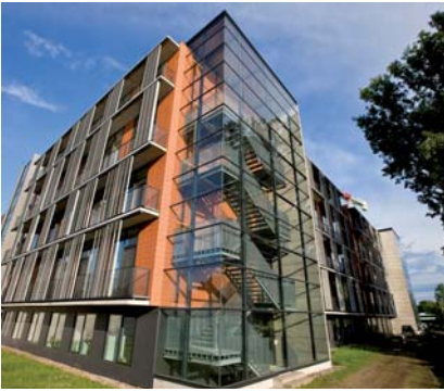
Das Kreiskrankenhaus Hameln verfügt über 450 Betten in zwölf Fachabteilungen, 1 100 Mitarbeiter versorgen jährlich 23 000 Patienten.

Landkreis leistet, überzeugt und davon, dass wir diese Partnerschaft mit Sana brauchen, um unser Krankenhaus fit und wettbewerbsfähig für die Zukunft zu machen. Bestes Zeichen für das Einverständnis war in jedem Fall die breite Zustimmung der Mitarbeiterinnen und Mitarbeiter des Krankenhauses sowie der Ärzteschaft, die sich im Vorfeld für diese Partnerschaft ausgesprochen hatten.